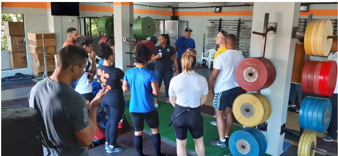
Na foto, reunião com atletas, treinadores e comissão técnica.

Com boa organização e excelente participação dos atletas, permitiu uma avaliação técnica deles.