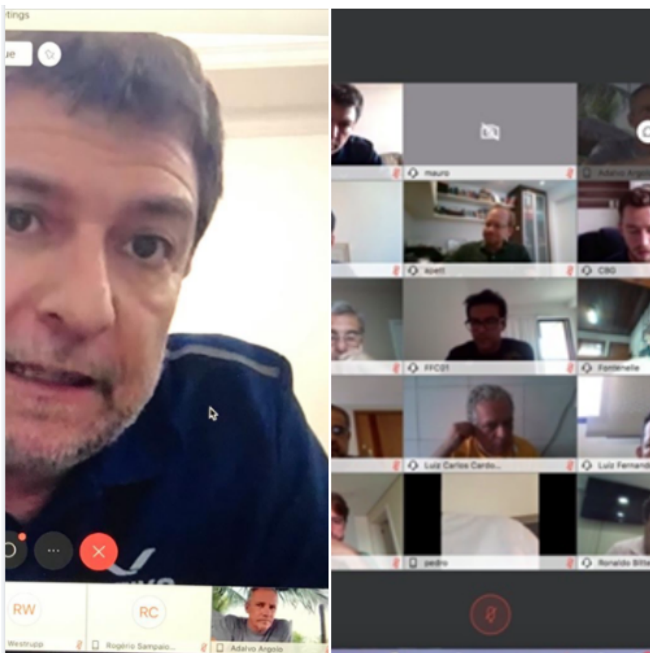
Na foto, Reunião de trabalho com 34 Presidentes.

Defendemos o isolamento social, como preconiza as autoridades de saúde. Apesar do Isolamento social o trabalho não para.